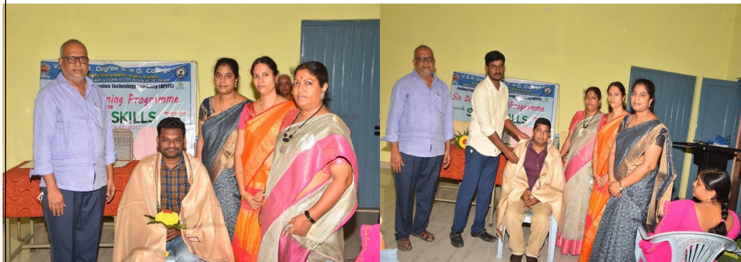
Felicitation to the Resource Persons