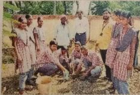
మొక్కలు నాటుతున్న ఎన్ఎస్ఎస్ వాలంటీర్లు

పెదననగల్లు(కూచి పూడి), న్యూఓటేడ్ : వాతావరణ కాలుష్యం ముమ్మరిస్తున్న ఈ తరుణంలో మానవ మనుగడకు మొక్కలే ఆధారమని, వాటిని నాటి సంరక్షించడం ప్రతి బోరుని బాధ్యత అని స్థానిక ప్రముఖుడు మీం గోపాలకృష్ణయ్య కె.బ్రహ్మం పేర్కొన్నారు. మొవ్వ వీవెస్ఆర్ ప్రభుత్వ డిగ్రీ వీజీ కళాశాల ఎన్ఎస్ఎస్ యూనిట్ ఆధ్వర్యంలో గురువారం మండల పరిధి లోని పెదననగల్లులో ప్రత్యేక శిబిరం నిర్వహించారు. వనం-మనం కార్యక్రమంలో భాగంగా స్థానిక జిల్లా పరిషత్ ఉన్నత పాఠశాల, ఎంపీపీ ప్రాథమిక పాఠ