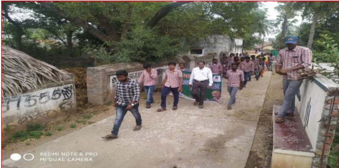
Awareness programme on AIDS/HIV at Pedasanagallu village

commemorate those who have died. NSS team and NSS Volunteers Participated in the rally on 1-12-2020 which emphasised the awareness of AIDS, HIV. NSS Volunteers efforts to prevent new HIV infections, increase HIV awareness and knowledge, and support those living with HIV.