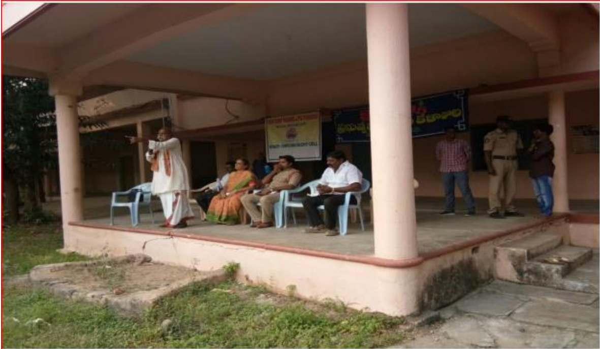
Awareness Program on Safety and Security of Women and Girls