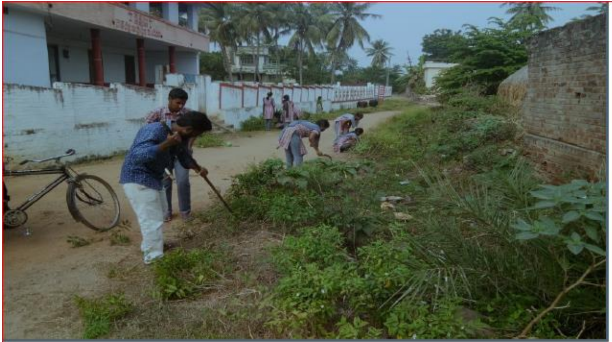
Swachha Bharat, Clean and Green Activity