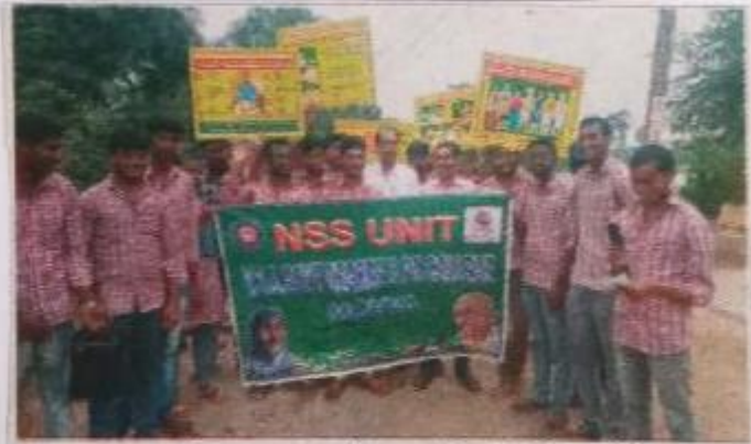
ఎయిడ్స్ పై ప్రచారం చేస్తున్న ఎన్ఎస్ఎస్ వలంటీర్లు