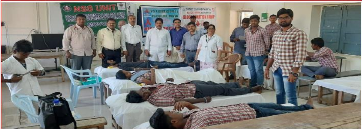
NSS Volunteers Donating blood