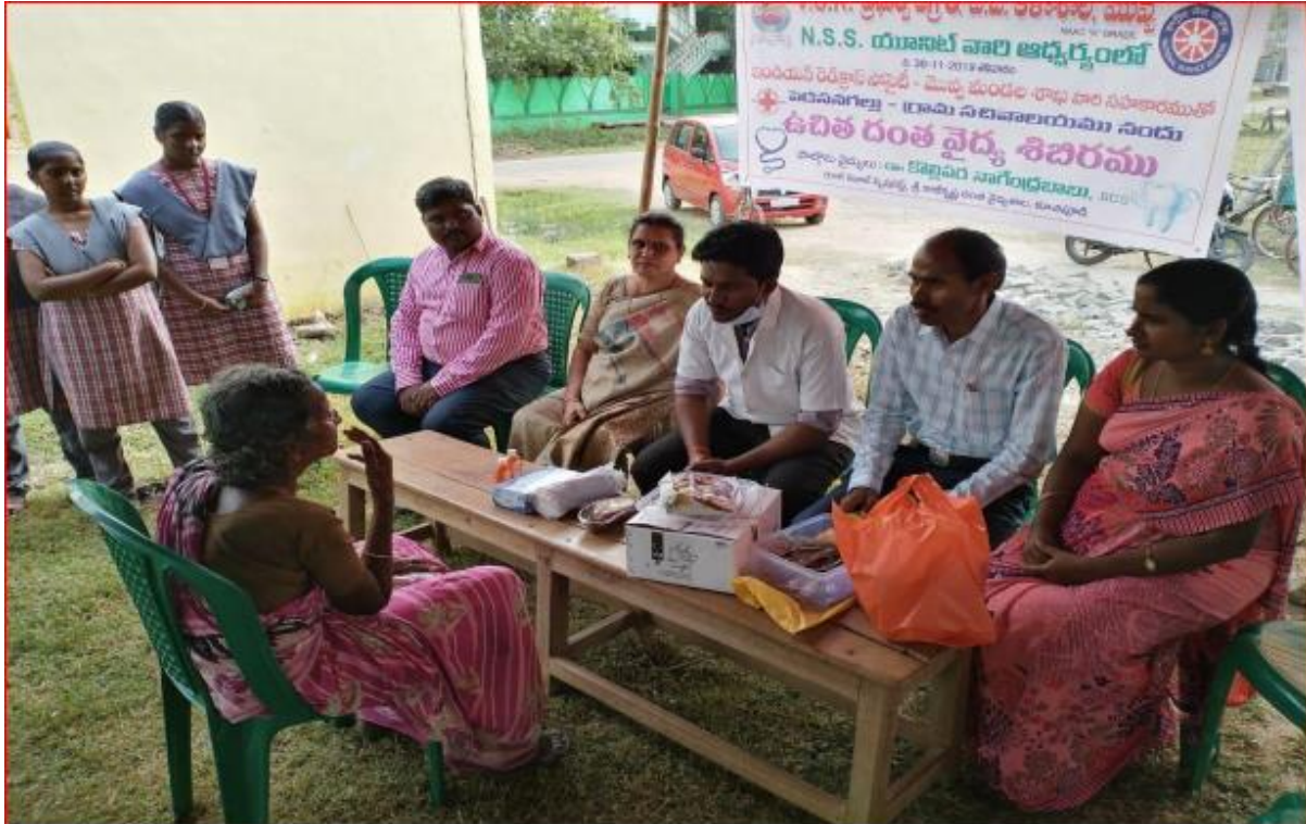
Free Medical Camp (Dental)