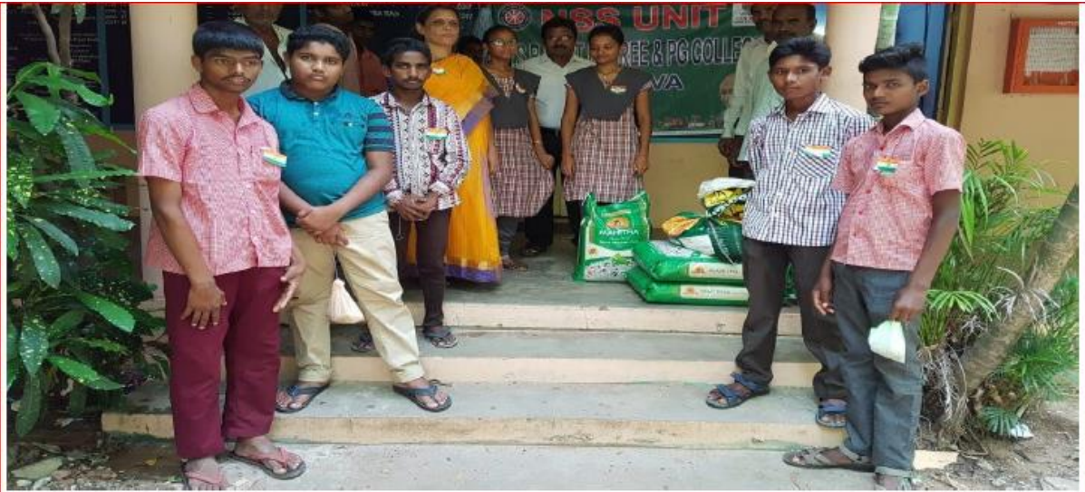
Rice & Snacks Distribution to Sireesha Orphan School & Rehabilitation Centre Veerankilakula near Vuyyuru