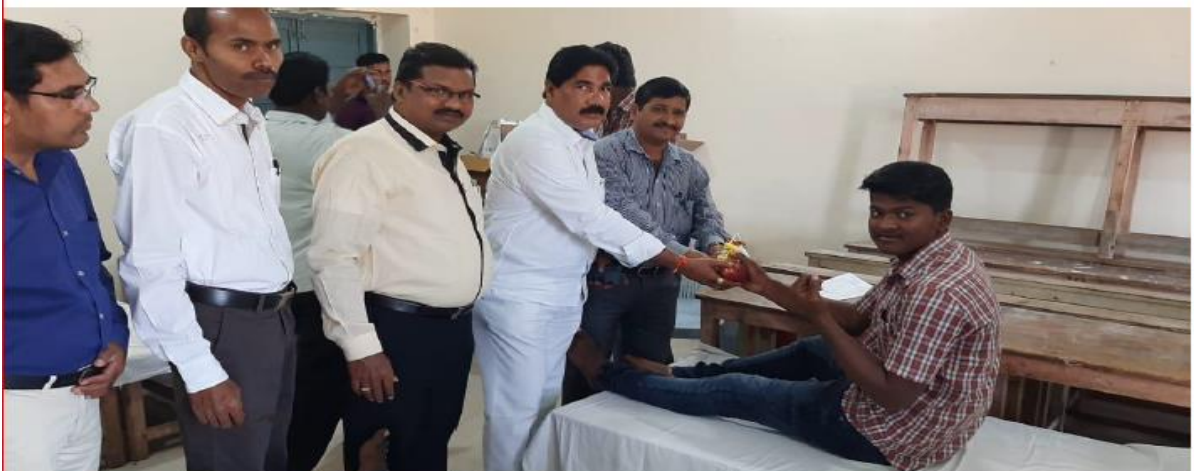
Fruits Distribution to Blood Donors